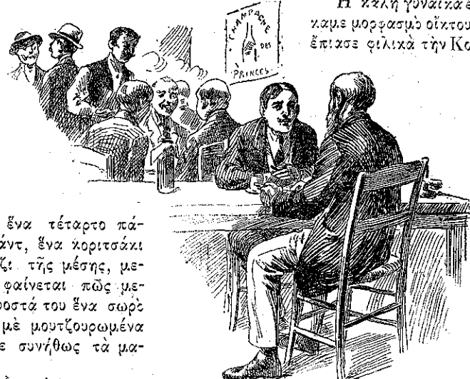
* Επιτέλους έπιασε γνωριμία με τόν Σομώ... *

Κ' ένώ έλεγε αυτά, έχωσε τό χέρι τής στό κάτω μέρος τού μπουφέ κ' έβγαλε καμμία δεκαριά μπουτίλλιες διαφόρων σχημάτων και χρωμάτων.